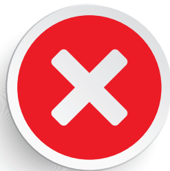
Fjetja shtrirë me bark